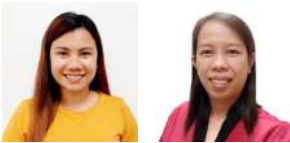
By Sarah Jane A. Reyes and Doreen Morgado