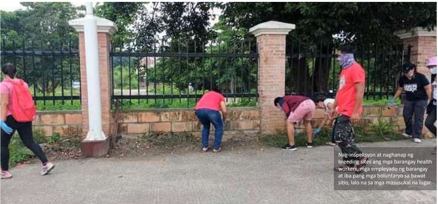
Nag-inspeksyon at naghanap ng breeding sites ang mga barangay health workers, mga empleyado ng barangay at iba pang mga boluntaryo sa bawat sitio, lalo na sa mga masusukal na lugar.