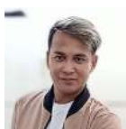
Ni Joler Mameng

Higit 1,000 seedlings ng beach agoho ang sama-samang itinanim ng mga kabataan at kasapi mula sa iba't ibang ahensya ng lokal na gobyerno ng Semirara bilang paggunita sa Linggo ng Kabataan.