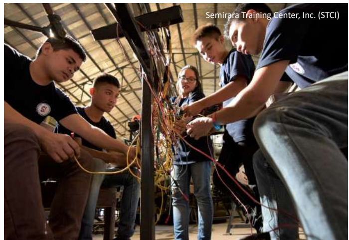
Semirara Training Center, Inc. (STCI)