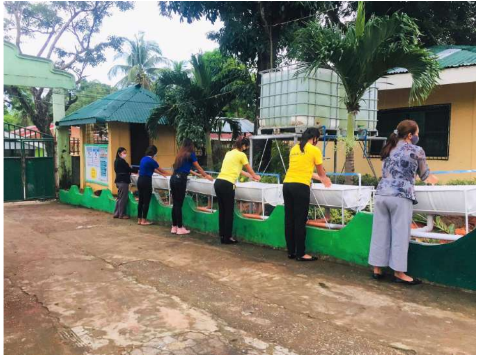
(Leftmost photos) Series of dry-runs and orientations for modular and online learning were attended by DWSSII teachers and administrators followed by simulation with the parents and pupils at home prior to the opening of classes on September 7. (Right) SMPC continues to install hand washing facilities to schools on the island to promote hand hygiene as part of the minimum health protocol advised by the Inter-Agency Task Force.