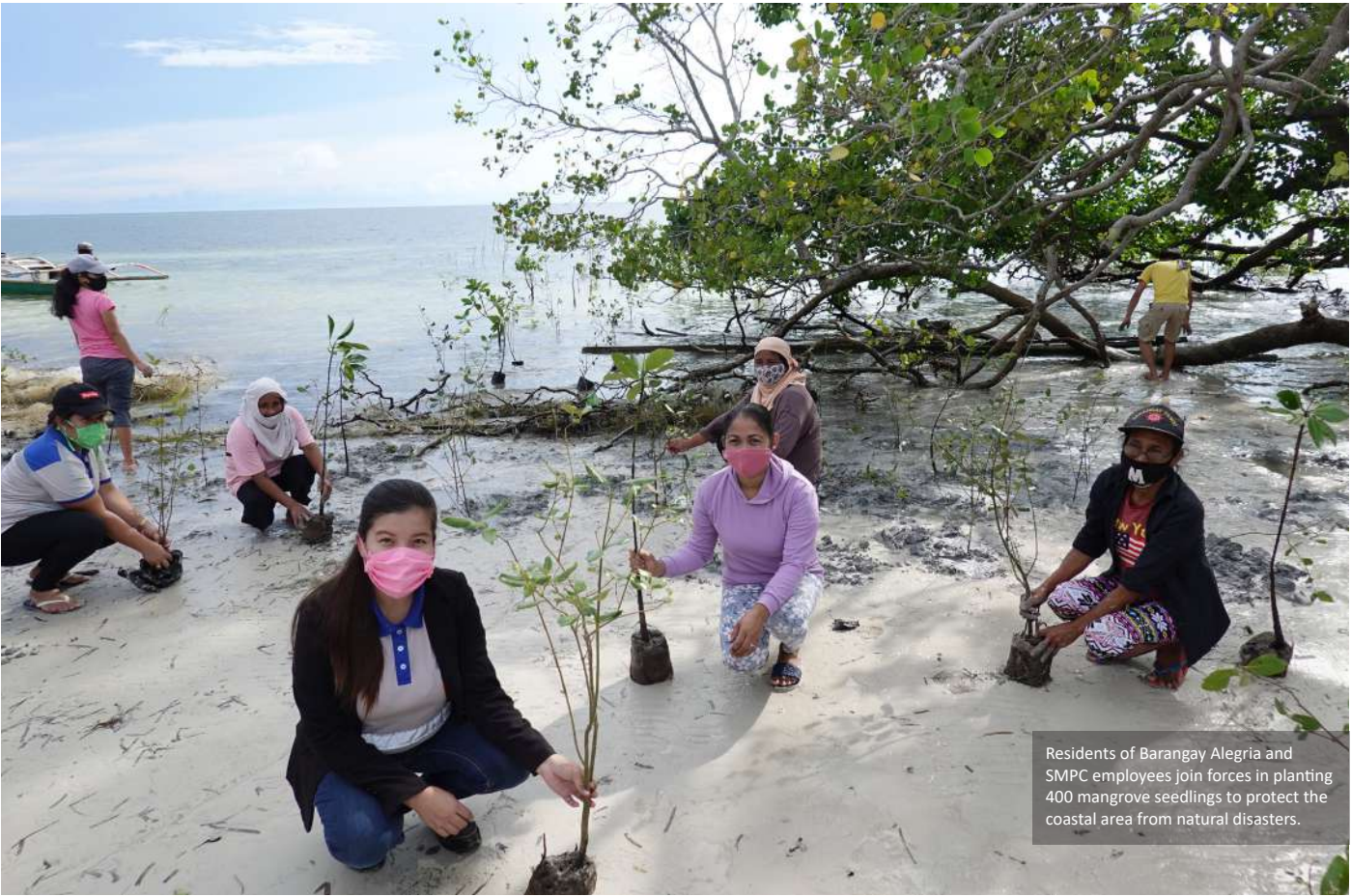
Residents of Barangay Alegria and SMPC employees join forces in planting 400 mangrove seedlings to protect the coastal area from natural disasters.