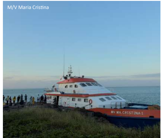
M/V Maria Cristina

Mula sa simpleng pamumuhay sa isla, unti-unting nagbago ang buhay ng mga Semiraranhon dahil sa responsableng pagmimina ng SMPC na nagdulot ng positibong ambag sa kanilang mga kabuhayan at panlipunang kalinangan habang pinoprotektahan ang kapaligiran. Lahat ng ito ay dahil sa pakikipagtulungan ng SMPC sa mga lokal na pamahalaan at sa patnubay at pahintulot ng Department of Energy na siyang regulador nito.