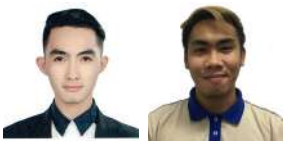
By Justine P. Balbin and Ian Glenn B. Conejar